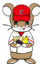
中国財務局マスコットキャラクター 「ざいちゅう」

さらなる地域経済の活性化を支援し、地元から感謝される取組を推進することや、当局の地域連携に関する取組を発信することを目的として、令和3年9月21日付で「地域経済活性化本部」を設置しましたのでお知らせします。